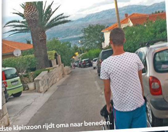
Oudste kleinzoon rijdt oma naar beneden.