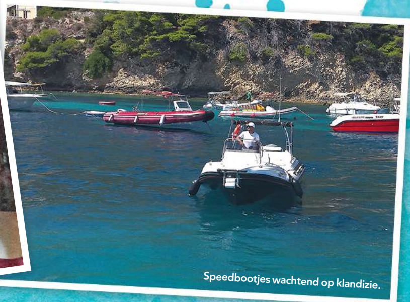
Speedbootjes wachtend op klandizie.