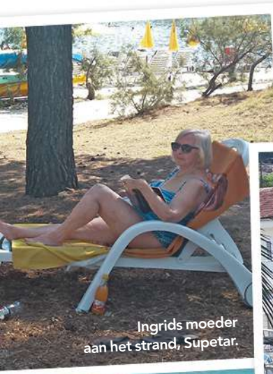
Ingrids moeder aan het strand, Supetar.