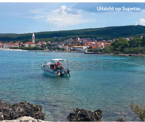
Uitzicht op Supetar.

dan het shirtje of andersom? Elke ochtend vraagt ze waar haar panty-kousjes zijn. De combi ‘mooi weer, blote benen, zomerkleren’ maakt ze niet meer. Door verandering van omgeving raakt ze haar routine kwijt. Wat ze dan wel weer onthoudt, is dat de wc-bril in het huisje nog steeds niet gemaakt is. Schoonmaken, ook zoiets. Dat verleert ze nooit. “Heb ik de tafel al schoongemaakt, Ingrid?” Ja, na zes poetsbeurten is er geen bacterie meer op te vinden. Elke ochtend en avond vraagt mijn moeder wanneer we weer teruggaan. Vanaf dag één. Want we zitten hier nu ‘al maanden’. Tien dagen vakantie maakt haar voor het eerst onrustig. Ze geniet van de excursies, het strand, uit eten gaan, haar kleinzonen, maar mist haar veilige haven. Vorig jaar kreeg ze niet genoeg van het dansen en flirten met de Turkse obers. Geen avond sloeg ze over. Tot diep in de nacht leerde ze hun stijldansen. Mijn moeder wilde ▶