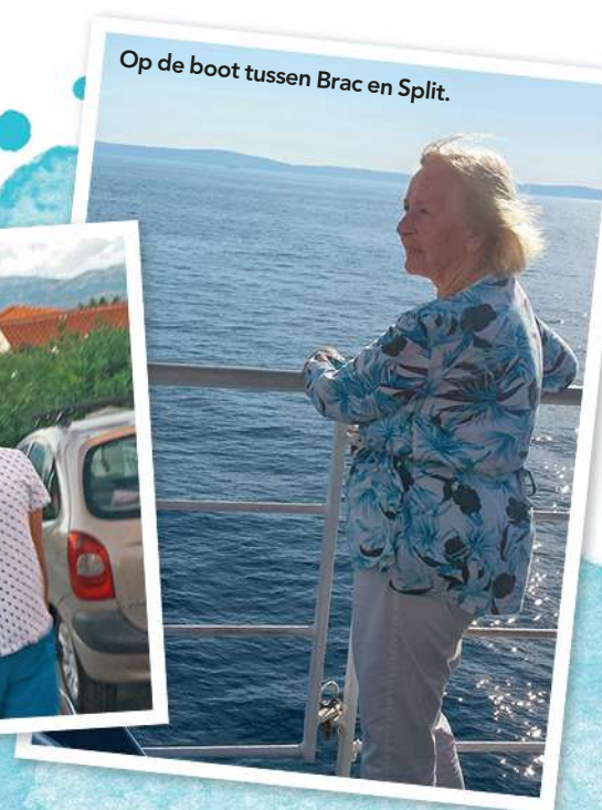
Op de boot tussen Brac en Split.