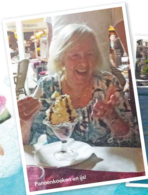
Pannenkoeken en ijs!