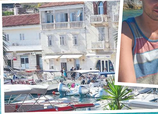
Vakantie: zon, varen, plezier.